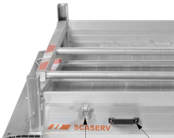
Závěsné oko pro přepravu jeřábem Madlo pro snadné přenášení Pojistný otvor proti posunu